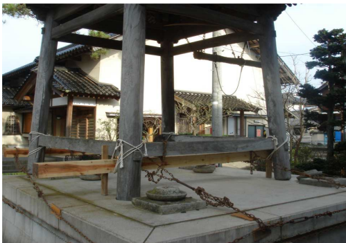
図1 鐘樓の水平移動

木造建物における耐震要素として、土壁や筋かいなどの耐力壁だけでなく建具などの非構造要素も挙げられる。例えば図3に示す2007年能登半島沖地震の被害例を見ると、建具がせん断変形して地震時に抵抗した痕跡が見られる。実際に図4のような構造実験結果からも建具の有り無しで耐力に差があることがわかっている。