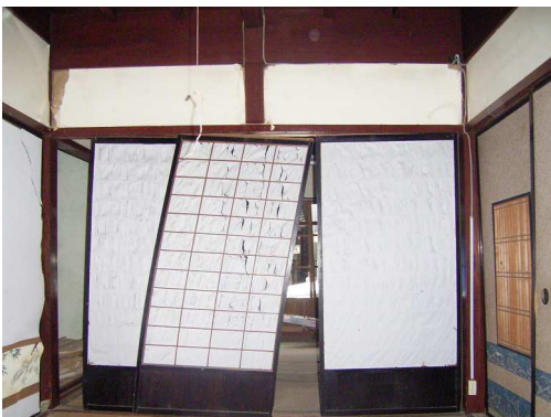
図3 建具の地震被害