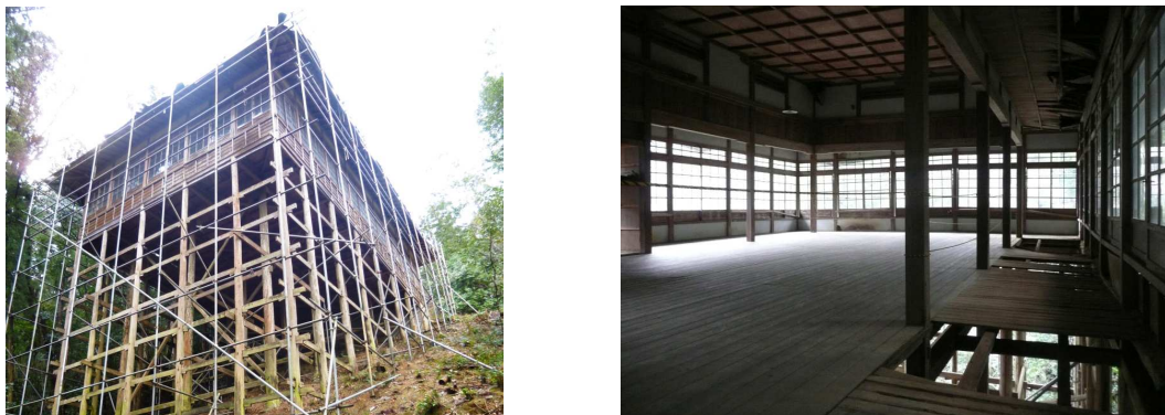
図5 少彦名神社参籠殿

木造建物の耐震設計法として、壁量計算、許容応力度計算、限界耐力計算、時刻歴応答解析が挙げられる。この中で壁量計算と許容応力度計算は建物の強度が大きいほど有利な計算方法となっており、耐力が低く変形性能の高い伝統構法の木造建物にとって不利になる場合がある。一方、限界耐力計算と時刻歴応答解析は建物の強度と変形性能を考慮した計算方法であり、伝統構法の木造建物の構造的特徴を適切に反映できる可能性がある。限界耐力計算は建物を一質点系に縮約した簡易な計算方法であり、時刻歴応答解析は建物を精緻にモデル化することで詳細な計算が可能である。時刻歴応答解析の例として図5に示す愛媛県大洲市に現存の少彦名神社参籠殿を紹介した。この建物は地山の斜面上に建っており、内部に壁がほとんどない伝統構法の木造建物である。時刻歴応答解析を行うことにより、耐震性能を適切に評価できることを示した。